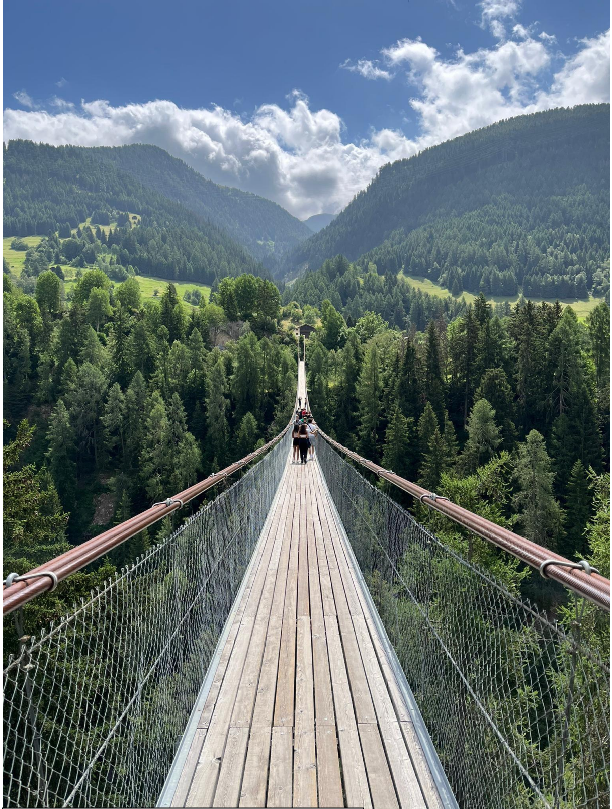
Camp ados été au Tessin Juin 2022